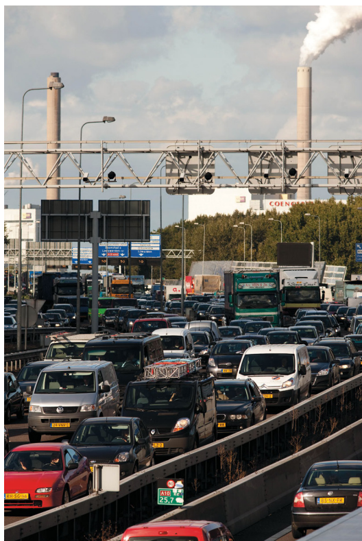
Figuur 2 We verbruiken veel energie.

b Houden we onze lucht gezond? Beargumenteer je antwoord met behulp van figuur 1 en 2.